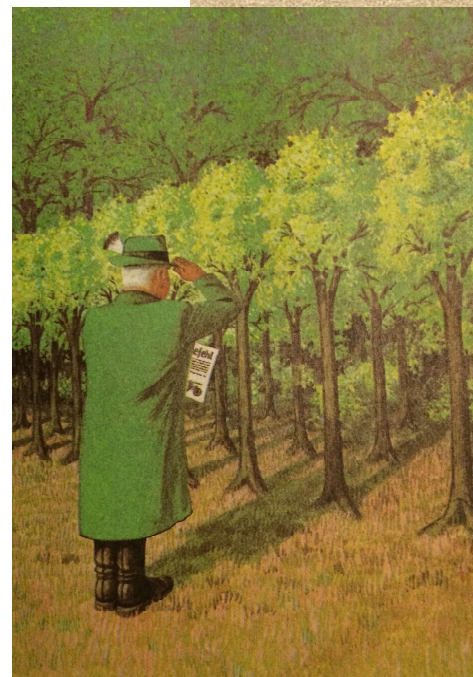
Woche des Waldes „In Anerkennung ausgezeichneten Wachstums befördere ich das gesamte Unterholz vom Jagen 512 zum Oberholz!“

1966 Johannes R. Becher Medaille 1978 FDGB-Kunstpreis ab 1980 stiftete er den EDDI für „Nichtwürdenpreisträger“ 1985 Goethepreis des Magistrats der Stadt Berlin